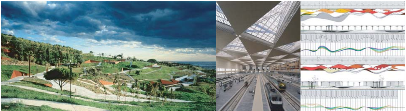
Jardín Botánico de Barcelona